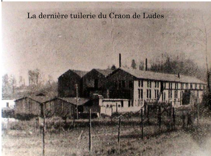
La dernière tuilerie du Craon de Ludes

7- Des autorisations personnelles de prolongation d'ouverture, révocables, fondées sur le caractère particulier de l'établissement, pourront être accordées aux débitants de boissons, hors restaurants, à la demande motivée de l'exploitant, par l'autorité préfectorale compétente, sur avis du maire, des services de police ou de gendarmerie, sous réserve des exigences de la sauvegarde de l'ordre et de la tranquillité publics et du respect des dispositions du décret du 15 décembre 1998 pour les établissements concernés. Elles ne pourront excéder une durée d'un an, ni dépasser 3 H 00 du matin. Tout changement de propriétaire ou de gérant de l'établissement rendra caduque la présente autorisation.